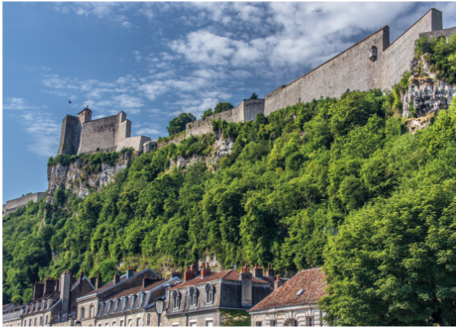
ACTUALITÉS NOTRE AGENCE ARTHUR LOYD BESANÇON ÉVOLUE ! PAGE 4