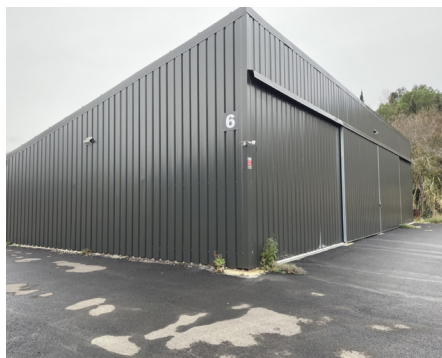
NISSAN LEZ ENSÉRUNE