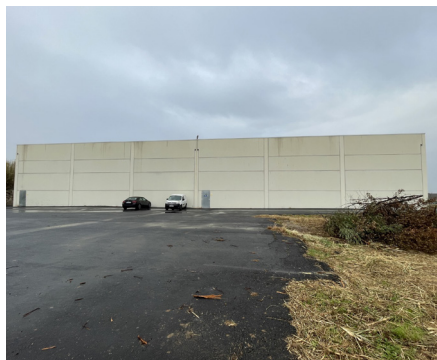
VILLENEUVE LES BÉZIERS