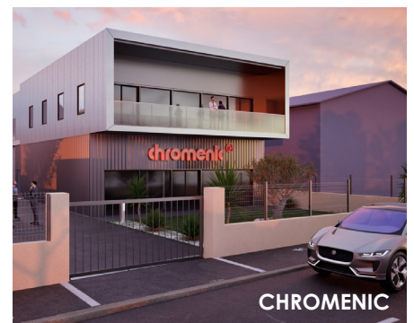
VILLENEUVE LES BÉZIERS