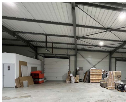
GALLARGUES LE MONTUEUX

LOCAUX D'ACTIVITÉ À LOUER 430 m² d'entrepôt + 283 m² de bureaux Référence : 1334718