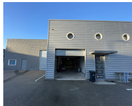
BOUJAN SUR LIBRON