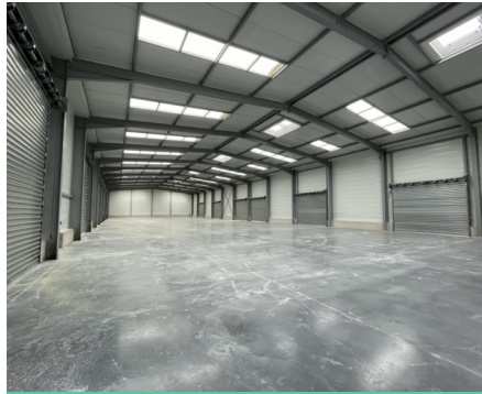
VESTRIC ET CANDIAC

LOCAUX D'ACTIVITÉ À LOUER 400 m² non divisibles Référence : 1308180