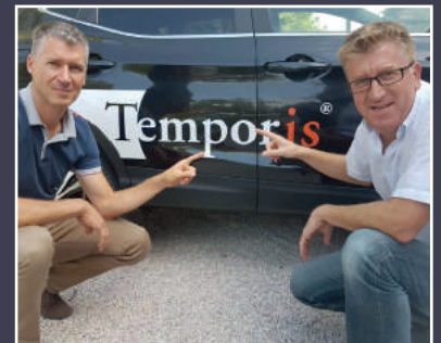
AGENCE TEMPORIS 30 avenue du Drapeau à Dijon

« C'est une agence immobilière sérieuse, qui a pignon sur rue, et qui a véritablement joué le rôle d'interface entre le vendeur et moi l'acquéreur. »